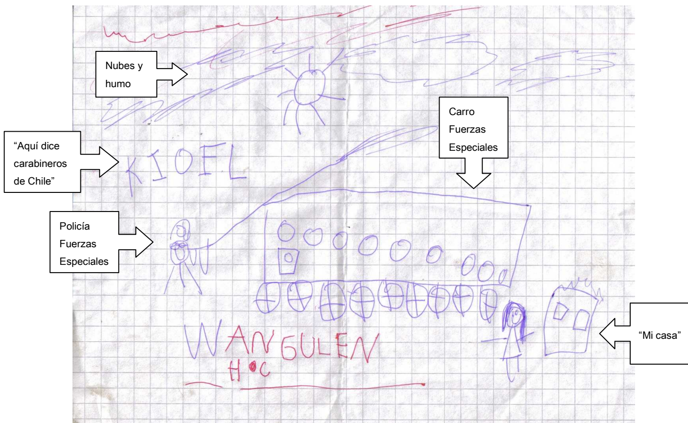
Dibujo de allanamiento a su comunidad, realizado por W.H.C. 06 años.